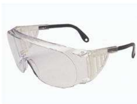
Lunettes de sécurité